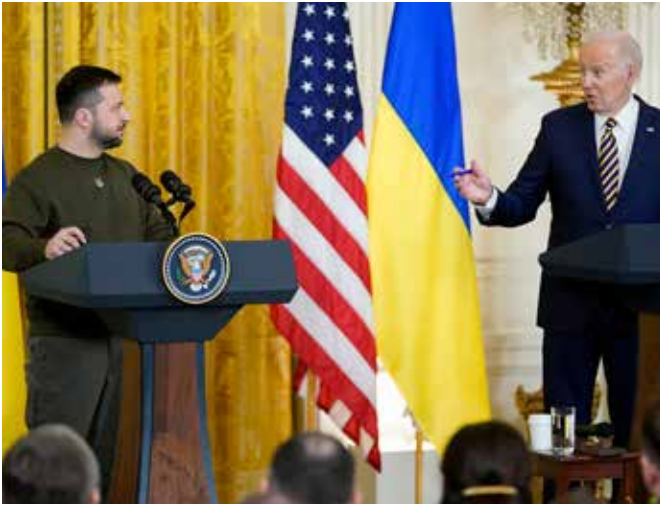
Volodymyr Selenskyj (l.) und Joe Biden: Die USA haben bisher mehr als 24 Milliarden US-Dollar an Sicherheitsunterstützung für die Ukraine zugesagt.

Extremismus sind. Es geht um die Hintergründe und unglaublichen Auswüchse des Kulturkriegs und der Formierung des religiösen Fundamentalismus, rechtsradikaler Kräfte, der toxischen Männlichkeitskultur und eines Waffenkults, in dem schon Mini-AR-15-Schnellfeuerwaffen für Kinder vertrieben werden. Und natürlich auch die Auswirkung dieser Kultur auf die Wirtschaft und das transatlantische Verhältnis.