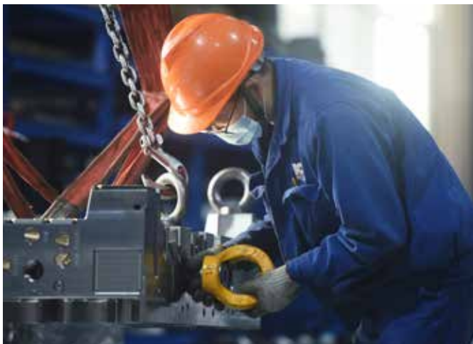
China: In Hangzhou werden Scheinwerferblenden für Autos produziert.

Fondsmanager Stöckle investiert außerdem in Mittel- und Lateinamerika – unter anderem in mexikanische Finanztitel, die davon profitieren, dass US-amerikanische Industriezentren ihre Produktion wieder ins eigene Land oder ins unmittelbar benachbarte Ausland zurückholen. In Brasilien setzt der Fondsmanager dagegen auf ein Bildungsunternehmen, das Privathochschulen im