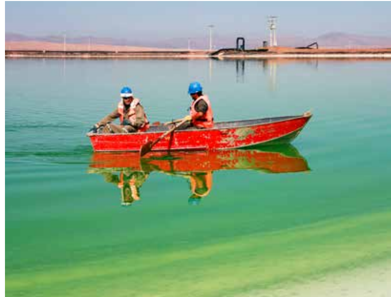
Lithium-Abbau: Das Karbonat wird im Salzsee der Atacama-Wüste gefördert, indem das Grundwasser in Becken gepumpt wird und dort verdunstet.

Für Spormann ist auch der Blick nach Asien besonders lohnenswert. Hier bedeutet das Ende der rigorosen Corona-Lockdown-Politik in China einen Impuls für das Land und die ganze Region. Auch die Krise am dortigen Immobilienmarkt mit den Finanzierungsproblemen großer Wohnungsbaufirmen soll ent-